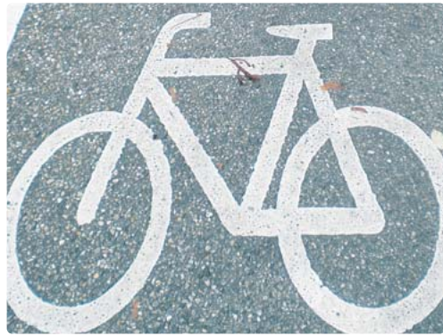
Mehr Aufmerksamkeit und bessere Bedingungen für Radfahrer fordert das Bürgerbegehren Radentscheid München.

Von dort geht es um 12 Uhr über die Hansastraße auf den Mittleren Ring Nord, dann über die Isarparallele und die Kapuzinerstraße wieder zurück zur Theresienwiese. Mit der Fahrt über den Mittleren Ring, dem Symbol der autogerechten Stadt der 70er Jahre, soll die Forderung unterstrichen werden, dass die Politik für den Radverkehr dasselbe Maß an Aufmerksamkeit aufbringt, wie es der Autoverkehr in dieser Stadt genießt. Um 14 Uhr ist auf der Theresienwiese eine Abschlusskundgebung mit Musik geplant. Das Bürgerbegehren für einen besseren Radverkehr wird getragen von ADFC, Bündnis 90/Die Grünen, BUND Naturschutz, Die Linke, Green City e.V. und ÖDP sowie zahlreichen Partnern. bb