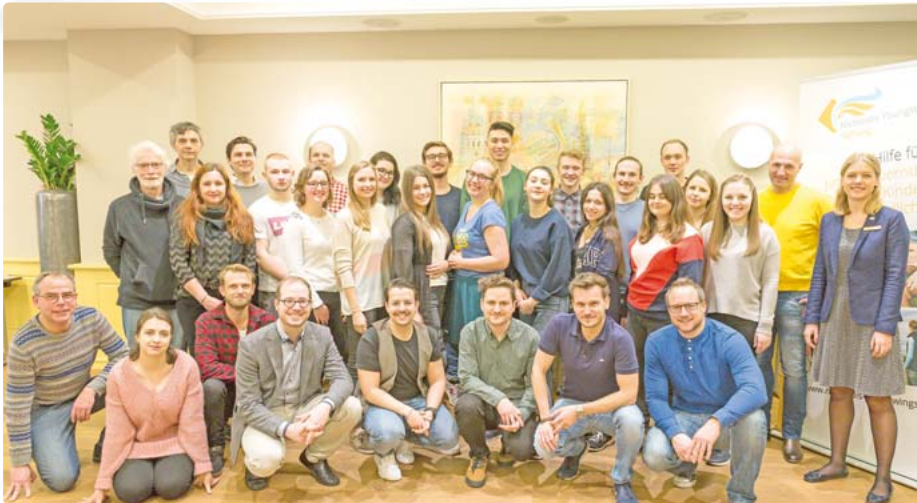
Wichtiger Austausch: Zweimal im Jahr treffen sich Stipendiaten und Paten des Sebastian Bildungsstipendiums. Die „Nicolaidis YoungWings Stiftung“ hat das Projekt, das auf Annemarie und Günter Sebastian zurückgeht, ins Leben gerufen.

„Nicolaidis YoungWings Stiftung“: Wie junge Halb- und Vollwaisen in Ausbildung unterstützt werden