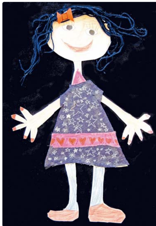
„Mode“ und „Haute Couture“ präsentieren die Kinder der Malschule Germering.

Die Ausstellung ist zu folgenden Zeiten im Forum der Stadthalle zu sehen: am Mittwoch, 3. Juli, und Donnerstag, 4. Juli, von 15 bis 18 Uhr; am Freitag, 5. Juli, und Samstag, 6. Juli, von 17 bis 23 Uhr sowie am Sonntag, 7. Juli, von 10 bis 14 Uhr. Der Eintritt ist frei. red