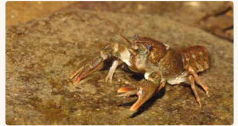
Der Steinkrebs ist die vermutlich stammesgeschichtlich älteste Krebsart in Mitteleuropa.

Die Biologin skizziert auch das Paarungsverhalten der Tiere und berichtet von der Krebspest, die eine weitere Ursache für die Dezimierung unserer Großkrebse darstellt. Die Krankheit wurde durch aus Aquarienhaltung stammende, amerikanische Krebsen, die selbst dagegen weitestgehend immun sind, eingeschleppt und bedeutet einen grausamen Tod für die Tiere.