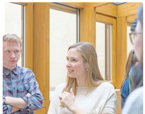
Die Stipendiaten treffen sich zweimal jährlich in München. Dabei haben sie die Möglichkeit zum Erfahrungsaustausch.