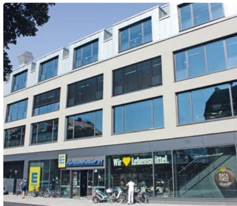
Das ehemalige Beck-Haus in Laim: nach 25 Jahren Ruinendasein wurde es wiederbelebt.

deren Umsetzung aus den Bereichen Architektur, Landschafts-, Innenarchitektur sowie Stadtplanung besichtigt werden können. Die Architekten und ihre Bauherren geben Auskunft über die Objekte und informieren interessierte Besucher vor Ort. Am Samstag und Sonntag, 29. und 30. Juni, haben diesmal 244 Projekte in 148 Orten ihre Türen, Tore und Gartentüren geöffnet.