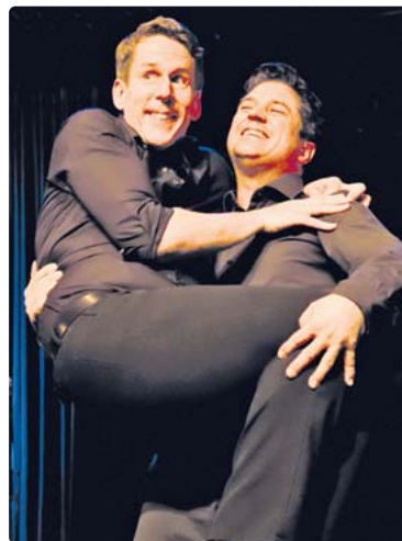
Im Finale: Die English Lovers.

über den Polarkreis bis nach Indien reichten, die von Elternsprechtagen, Klimafragen und Apfelmus erzählten – mal gesungen, mit großen Emotionen oder sogar ohne Worte. Das Publikum hatte es wirklich nicht leicht, sich per Applausometer für ein