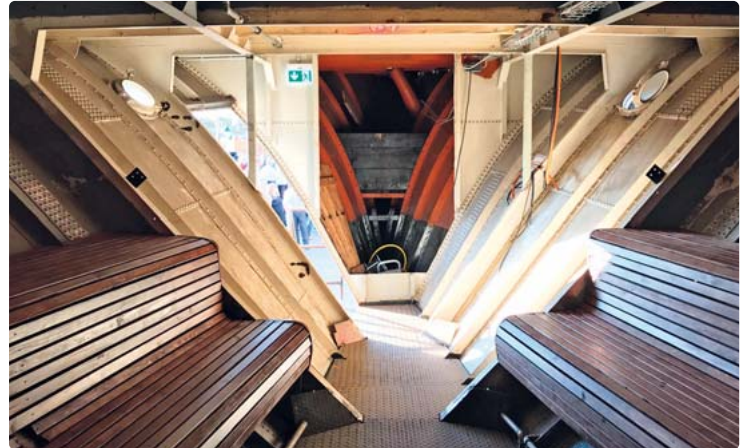
Im Bauch der Utting in Sendling. Der ausgediente Ammerseedamper ist jetzt ein Veranstaltungsort.