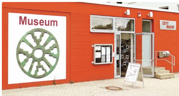
Beherbergt die Ausstellung „Zeit und Raum“: das Museum am Rathaus in Germering.

Germering · Seit zwanzig Jahren gibt es inzwischen den „Förderverein Stadtmuseum Germering“. Aus diesem Grund ist im Museum am Rathaus die Ausstellung „Zeit und Raum“. Gezeigt werden Zeitdokumente aus der Arbeit des Vereins und seiner Vorgeschichte bis heute.