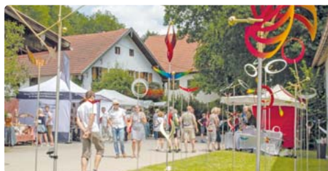
Kunst und Kunsthandwerk in schönem Ambiente präsentiert die Veranstaltung „Kunst & Handwerk im Stadt“.

Kunst im Stadt - ein Event für die ganz Familie