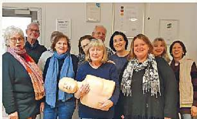
„dein Nachbar“ schult seine Helfer kostenlos und professionell. Die nächsten Schulungstermine für Alltagsbegleiter sind am 13. und 14. Juli sowie am 20. und 21. Juli.

„Unser Anliegen ist es, dass ältere Menschen so lange wie möglich zuhause leben können. Darüber hinaus möchten wir vor allem auch pflegende Angehörige entlasten. Mit unserem vielfach ausgezeichneten Konzept verteilen wir die Last auf viele Schultern und sorgen