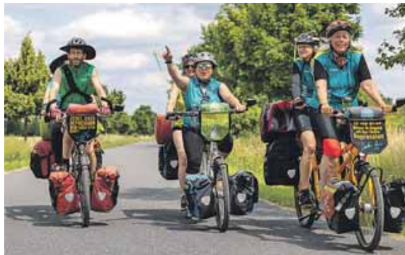
Mit dem Tandem durch Deutschland.

land. Auch Freising gehört 2025 zu den Haltepunkten. Die MUT-TOUR richtet sich an Menschen mit und ohne Depressionserfahrung, Angehörige sowie alle, die sich für das Thema starkmachen möchten. Sportliche Vor-