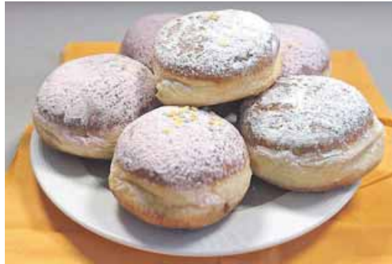
Schmeckt nicht nur zur Faschingszeit: Der Krapfen!

(chö) · Gerade jetzt sieht man ihn wieder in den leckersten Kombinationen in der Auslage beim Bäcker. Der Krapfen! Ob klassisch, mit fruchtiger Füllung oder in kreativen neuen Variationen – in der Faschingszeit gehört er einfach dazu. Doch woher stammt dieses beliebte Gebäck eigentlich, und warum ist es gerade jetzt so begehrt?