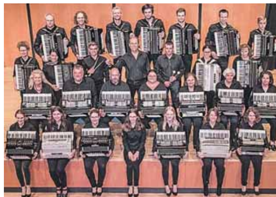
Das Akkordeonorchester »Erdinger Akkordtonsound«.