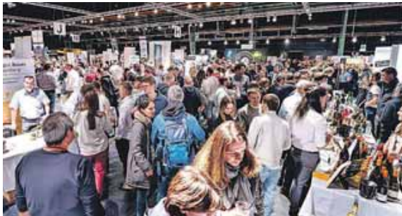
Ob rot, weiß oder rosé. Hier findet jeder etwas für seinen Geschmack.

(chö) · Mit einem Wein- glas in der Hand herum-bummeln und an den Ständen probieren und sich beraten lassen: Das können Weinfans bei der Vinessio Weinmesse München am 8. und 9. März. In der Zenith-Kulturhalle können sie ausgesuchte Weine, Spirituosen, Sekt, Seccos und Delika-