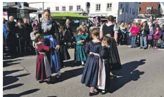
Die Jugend des Trachtenvereins zeigt mittags ihr Können.

An zahlreichen Marktständen bieten die Händler wieder ihre zum Teil selbst produzierten Artikel und Waren an. Es