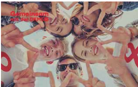
Die Registrierung dauert nur wenige Minuten und kann im Ernstfall Leben retten.

FREISING (chö) · Unter diesem Motto organisiert die staatliche Wirtschaftsschule Freising eine DKMS Stammzellenspenderaktion und bietet allen gesunden Menschen zwischen 17 und 55 Jahren die Gelegenheit, sich als potenzielle Spender registrieren zu lassen. Alle 12 Minuten erhält in Deutschland ein Mensch, darunter viele Kinder, die Diagnose Blutkrebs. Eine Stammzellenspende ist oft die einzige Chance auf Heilung. »Dieses Schicksal traf im August einen Kolle-