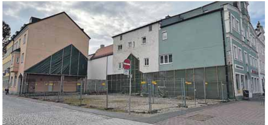
Seit Jahren ist das Grundstück in der Innenstadt unbebaut.

Mittwoch, 26. Februar, ab 18 Uhr in der Schule.