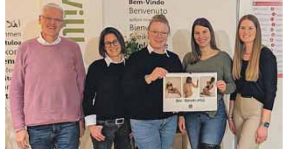
Mit einem Fotokalender haben die Buchner Bixn das Frauenhaus unterstützt.