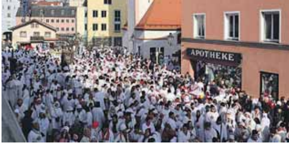
Ein Meer aus Menschen zieht am Hemadlenz'n durch Dorfen.

DORFEN (chö) - Es ist wieder soweit: Der traditionelle Hemadlenz'n-Umzug in Dorfen findet statt. Die Teilnehmer des Umzugs treffen sich am Donnerstag, 27. Februar, um 10 Uhr in der Erdinger Straße zu einem Zug, der sich dann, angeführt von der Stadtkapelle, über Johannisplatz, Kirchtorplatz, um den Marienplatz zum Unteren Marktplatz bewegt. In der Turmstube des Unteren Tores wartet das Prinzenpaar, das über eine Leiter vom Turm herabsteigt und sich an die Spitze des Zuges stellt. Der Zug zieht weiter in Richtung Rathausplatz. Hier okkupieren die Lenz'n das Rathaus und lassen den Bürgermeister ebenfalls mit einer Leiter aus dem 1. Stock absteigen. Vom Rathausplatz geht es weiter in die Brandstattgasse zum Unteren Marktplatz. Abschließend ziehen die Lenz'n zum Marienplatz, wo als Höhepunkt des Zuges eine Hemadlenz'n-Stoffpuppe auf einen Galgen gezo-