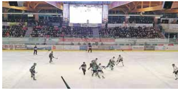
Die Gladiators sind in den Play-offs und spielen eine herausragende Saison.

Erfolgreiche Partnerschaft, Gladiators und Flughafen