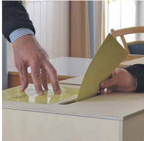
Am Sonntag, 23. Februar, ist es soweit. Die Bundestagswahl.

Umfragen deuten auf ein enges Rennen zwischen CDU/CSU, SPD, Grünen und AfD hin, sodass jede Stimme einen entscheidenden Unterschied machen kann. Nutzen Sie Ihr Wahlrecht – ob persönlich im Wahllokal oder per Briefwahl.