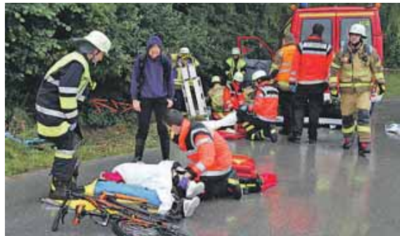
Das Aufgabenspektrum der First Responder ist breit. Es reicht von Einsätzen bei Herzinfarkten bis hin zur Erstversorgung von Verletzten. Hier ein Bild von einer Übung.

Im Jahr 2012 kam dann eine wegweisende Entscheidung. Gleichzeitig mit der Beschaffung zweier baugleicher Pkw als First-Responder-Fahrzeuge wurde auch das gesamte Konzept der Einheit verbessert und modernisiert: Seither werden nämlich die Einsatzfahrzeuge von den Feuerwehrdienstleistenden mit nach Hause genommen. Dadurch können die Kräfte im Alarmfall schneller an die Ein-