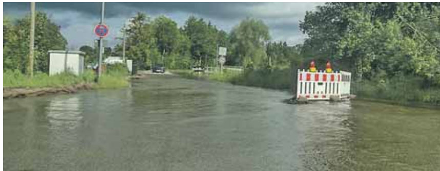
Bei Fahrten durch Hochwasser drohen Motor-, Batterie- und Elektronikschäden. Am besten ist es, bei Starkregen gar nicht erst loszufahren.

(Automobilclub KS, red) · Nach Hitzetagen schlägt das Wetter oft rasant um und Starkregen überflutet innerhalb von Minuten Unterführungen und tiefer gelegene Straßenbereiche oder Parkplätze. Auch können Bäche und Flüsse über die Ufer treten und angrenzende Bereiche überschwemmen. Wer Fahrten bei diesen Bedingungen vermeiden kann, lässt sein Auto am besten stehen. Was aber, wenn man bereits mit dem Auto unterwegs ist? »Idealerweise werden solche Gebiete weiträumig umfahren. Denn auch wenn Autos generell gut gegen jegliches Wetter geschützt sind: Beim Fahren durch stehendes Gewässer können der Motor, die Auspuffanlage, die Batterie oder