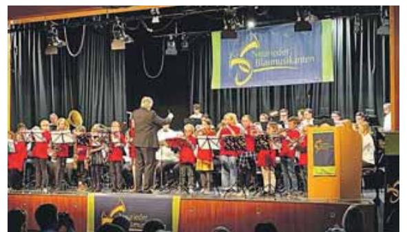
Die Neurieder Blasmusikanten stellen den Nachwuchs ins Rampenlicht.

Doch nicht nur das abwechslungsreiche Programm sorgt für Gänsehautmomente – auch die Moderation verspricht ein besonderes Erlebnis. Reinhild Jetter führt mit eloquenter, inspirierender und stimmungsvoller Moderation durch den Abend.