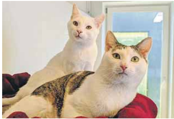
Pippa und Zeki warten im Tierheim München auf ihr neues Zuhause.

Tierheim München gibt Tipps zur Anschaffung von Katzen