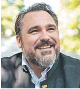
MdB Daniel Föst

Für den Norden der Stadt möchte Daniel Föst (48) erneut ins Berliner Parlament einziehen. Der 48-Jährige war in der vergangenen Legislaturperiode bau- und wohnungspolitischer Sprecher seiner Fraktion: »Die Krise in der Bau- und Wohnungspolitik ist die große soziale Frage unserer Zeit. Mittlerweile sind es 600.000 Wohnungen, die jährlich in Deutschland fehlen. Da helfen Instrumente wie kommunale Vorkaufrechte oder die Mietpreisbremse wenig – wir müssen