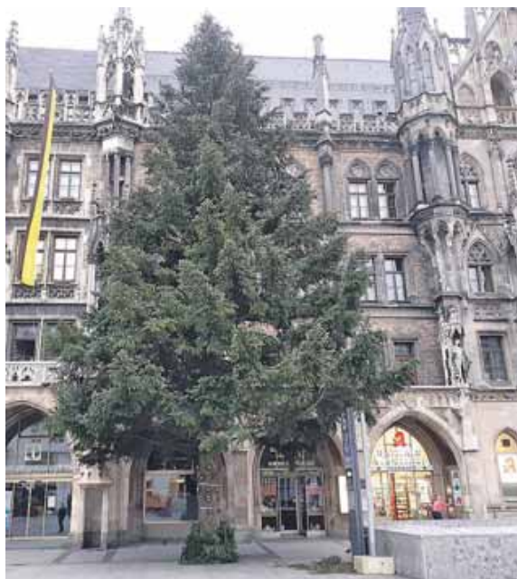
Der Christbaum auf dem Münchner Marienplatz.

Die Erlöse fließen in die Arbeit der Teestube und ermöglichen schnelle, unbürokratische Unterstützung. »Manchmal geht es um kleine Beträge, die aber einen großen Unterschied machen«, erklärt Lochner. Das können zum Beispiel die Mittel sein, um einen neuen Personalausweis zu beantragen oder für notwendige Medikamente, die nicht oder nur zum Teil von den Krankenkassen übernommen werden. Die Cristbaumaktion findet am 21. Dezember von 14 bis 18 Uhr, am 22. Dezember von 12 bis 18 Uhr und am 23. Dezember von 10 bis 16 Uhr statt. Abgabe solange der Vorrat reicht. Verfügbarkeit kann ab dem 21. Dezember unter der Tel. 089/77 10 84 erfragt werden.