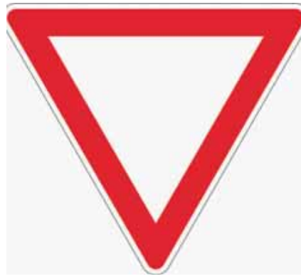
Das Verkehrszeichen »Vorfahrt gewähren« in Kombination mit ...

Beim Verlassen des Kreisverkehrs ist Blinken Pflicht; Radfahrer müssen bei der Ausfahrt ein Handzeichen geben. Viele Kreisverkehre haben spezielle Übergänge für Fuß-