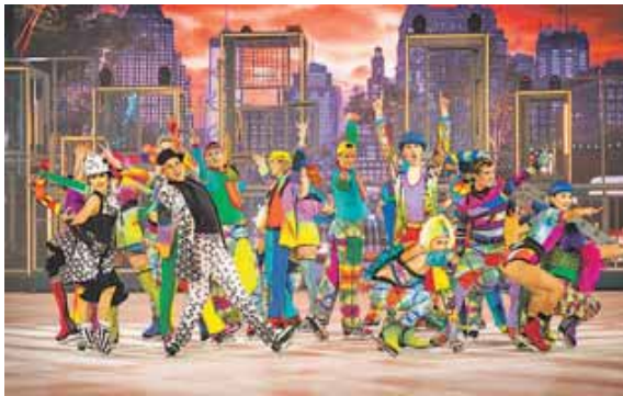
Seit Jahrzehnten beliebt: HOLIDAY ON ICE.

MÜNCHEN · The magic continues: Mit der spektakulären Show HORIZONS beginnt in diesem Jahr ein neues Kapitel von HOLIDAY ON ICE, der erfolgreichsten Eis-Show der Welt. Nach dem grandiosen 80. Jubiläum folgt nun das nächste Highlight. Unter dem Motto »Feel the City Beat!« packt HORIZONS das Publikum mit der Energie, der Bewegung und dem Sound einer pulsierenden Großstadt. Die neue Show erzählt von der Vielfalt und Faszination einer lebendigen Metropole – und allen voran den Menschen, die sie ausmacht. In einem unvergesslichen Live-Erlebnis auf dem Eis erweckt sie den einzigartigen urbanen Spirit zum Leben – vom 2. bis 5.1.2025 in der Münchener Olympiahalle.