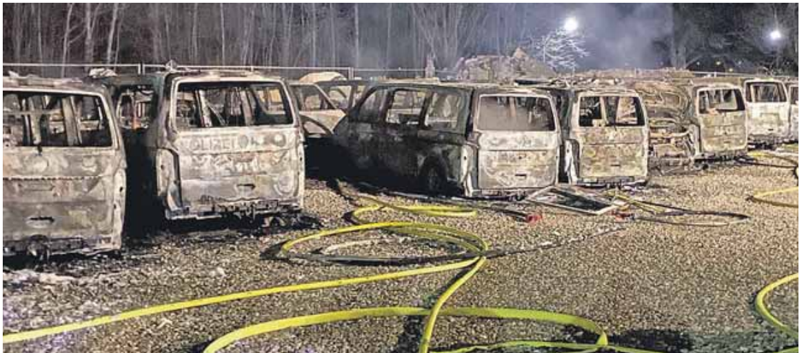
23 Autos der Diensthundestaffel brannten vollständig aus.

Zeugen gesucht: Innenminister sieht bei Brandanschlag »terroristische Züge«