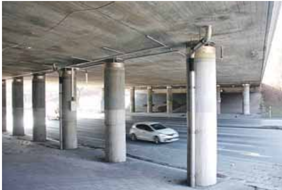
Die Kreuzhofbrücken wurden 1966 gebaut. Jetzt müssen sie abgebrochen werden.

ruar, 3 Uhr. Die A95 ist nicht betroffen – mit Ausnahme der bereits bestehenden Baustelleneinrichtungsfläche auf dem Standstreifen Richtung Garmisch. Der Verkehr aus Richtung Süden (Boschetsrieder Straße) wird über Aidenbach-, Murmauer und Höglwörther Straße, Luise-Kiesselbach-Platz und Waldfriedhofstraße umgeleitet. Der Verkehr aus Richtung Norden wird umgekehrt geführt.