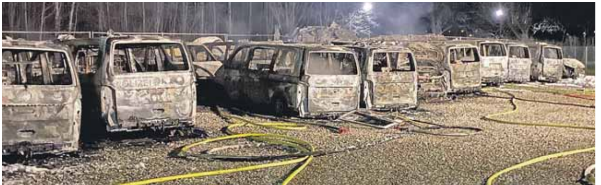
23 Autos der Diensthundestaffel brannten vollständig aus.

UNTERMENZING (job) · Nach dem mutmaßlichen Brandanschlag auf die Diensthundestaffel in der Nacht auf Samstag (25. Januar) sucht die Polizei Personen, die dazu sachdienliche Angaben machen können. Sie werden gebeten, sich mit dem ermittelnden Kriminalfachdezernat 4, Tel. 089/2910-0, oder einer anderen Polizeidienststelle in Verbindung zu setzen.