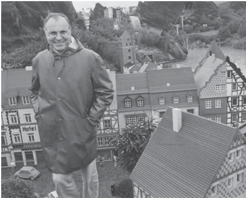
Großer Politiker im Legoland: Helmut Kohl machte als Kanzlerkandidat während seines Wahlkampfs 1976 dort Station.

Im Jahr 2021 übereignete Henriette Väh-Hinz, die Witwe des Fotografen, der Bayerischen Staatsbibliothek das gesamte Fotoarchiv ihres