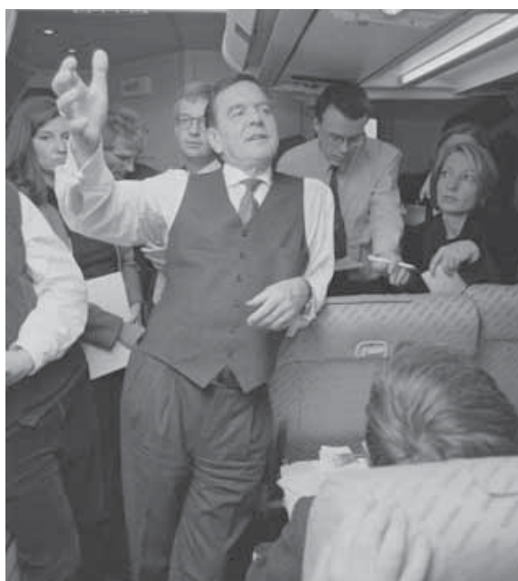
Nicht unumstritten und hier souverän mit großer Geste: Gerhard Schröder – fotografiert im Gespräch mit Journalisten auf dem Rückflug seines Besuchs in Warschau 1999.