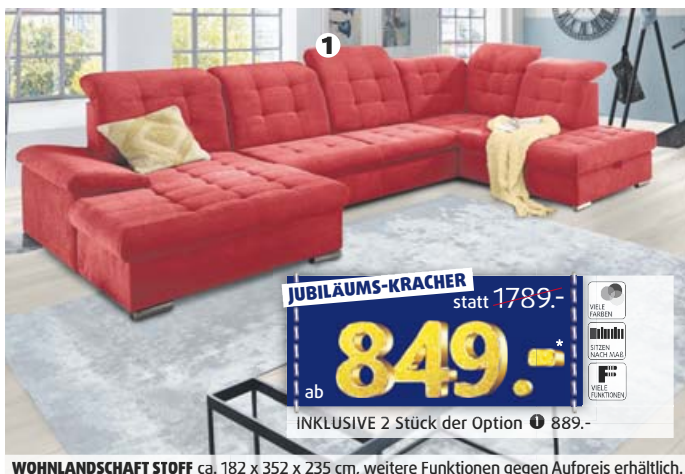
WOHLNDSCHAFT STOFF ca. 182 x 352 x 235 cm, weitere Funktionen gegen Aufpreis erhältlich.