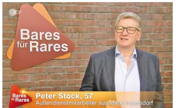
Der Indersdorfer war begeistert von seinem Auftritt bei »Bares für Rares«.

ALDI SÜD Dienstleistungs-GmbH & Co. oHG, Burgstraße 37, 45476 Mülheim Firma und Anschrift unserer regionalen Unternehmen findest du auf aldi-sued.de/filialen oder mittels unserer kostenlosen automatisierten Service-Nummer 0 800/8 00 25 34.