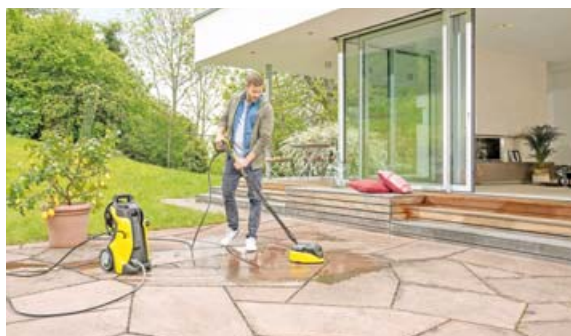
Mit dem Hochdruckreiniger und einem zusätzlichen Flächenreiniger lassen sich auch große Terrassen gründlich und schnell reinigen.

aber auch auf Steinoberflächen mithilfe von elektrisch betriebenen Bürstenwalzen und Wasser einfach beseitigen. Viele Verschmutzungen lassen sich bereits mit dem Einsatz der Geräte sowie Wasser beseitigen. Pflegemittel für die unterschiedlichen Materialien können das Saubermachen jedoch vereinfachen. Der Schmutz wird damit gelöst und kann dann leichter und schneller entfernt werden. Vor allem bei empfindlichen Holzoberflächen ist das sinnvoll, da man die Zeit verkürzt, die mit hohem Wasserdruck gearbeitet werden muss. Unter www.kaercher.de finden Terrassenbesitzer weitere Informationen sowie Tipps zum Reinigen des Outdoorbereichs. Spezielle Holzreiniger wirken außerdem pflegend und verbessern den UV-Schutz der Oberflächen. Wer lieber zu Hausmitteln greift: Auch Schmierseife eignet sich für Holz- und Steinterrassen. Bei Essig oder Sodalösung hingegen sollte man vorsichtig sein, da sie die Oberflächen angreifen.