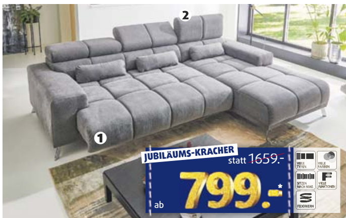
WINKELECKE STOFF ca. 285 x 201 cm, INKLUSIVE ① elektrischer Sitztiefenverstellung und 3x ② verstellbarer Kopfstützen.