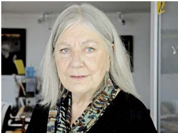
Mit der Lesung von Helga Schubert am 9. Oktober endet das Literaturfestival 2021.