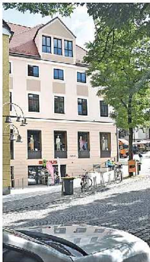
Schmuckkastl im Herzen der Dachauer Altstadt: das neu konzipierte Wohn- und Geschäftshaus »Birgmannforum«