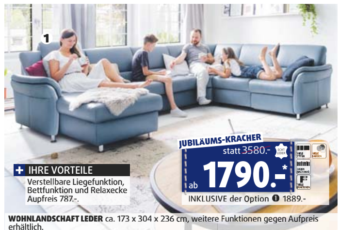
WOHLNDSCHAFT LEDER ca. 173 x 304 x 236 cm, weitere Funktionen gegen Aufpreis erhältlich.