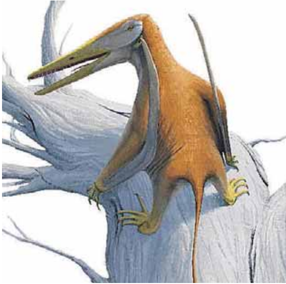
Lebendrekonstruktion von Melkamter pateko.

Vor etwa 230 Millionen Jahren, fast 80 Millionen Jahre vor dem Ursprung der Vögel, eroberten die Flugsaurier den Himmel, als erste Gruppe aktiv fliegender Wirbeltiere. Die Flugsaurier entwickelten den