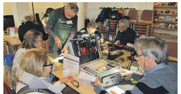
Zusammen reparieren: Am 25. Januar findet in der Freien evangelischen Gemeinde ein RepairCafé statt.

findet man unter www.germerring.feg.de/RepairCafe . Wer sich vorstellen kann, mit seinen handwerklichen Fähigkeiten anderen Menschen Gutes zu tun, ist im Reparaturteam gerne willkommen. Er kann sich per E-Mail unter RepairCafe@germering.feg.de melden. Das gilt auch für diejenigen, die erst einmal ganz unverbindlich dabei sein möchten, um das RepairCafé kennenzulernen.