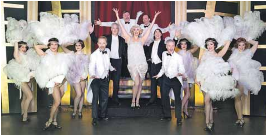
Am 8. Februar findet gibt es in der Stadthalle Germering eine Revue-Operette von Paul Abraham zu sehen.

Paul Abrahams 1932 uraufgeführter »Ball im Savoy« war der dritte große Erfolg in Folge, der den Komponisten zum unbestrittenen Star am Berliner Operettenhimmel machte. Nach »Viktoria und ihr Husar« und »Die Blume von Hawaii« versammelte er in »Ball im Savoy« alles, was das Mu-