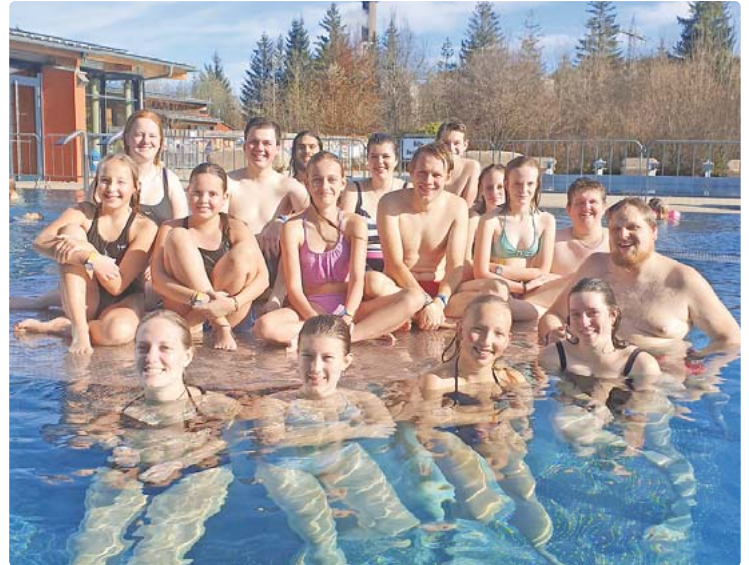
Mit einem Entspannungsausflug bedankte sich das Jugendrotkreuz der Ortsverbände Weilheim und Peißenberg bei den engagierten Helferinnen und Helfern des Ferienprogramms.

Für ihren engagierten ehrenamtlichen Einsatz bedankten sich die Verantwortlichen der beiden Ortsverbände beim Team mit einem ge-