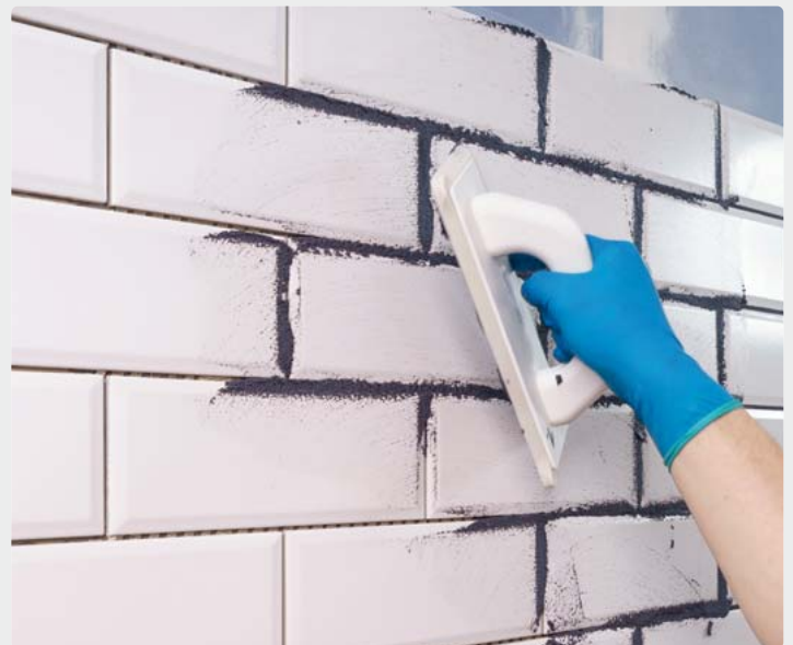
Feine Fugen: Mit den passenden Materialien lassen sich attraktive Fliesenflächen einfach selbst gestalten.

etwa die Flexfuge Universal von Knauf geeignet. Noch einfacher geht es mit gebrauchsfertigen Materialien wie der Flexfuge Smart, die direkt aus dem Eimer aufgetragen wird. Erhältlich sind die verarbeitungsfreundlichen Fugenmassen in vielen Baumärkten, unter www.verfliesen.de etwa gibt es weitere nützliche Verarbeitungstipps und Videos rund um das richtige Fliesen und Verfügen.