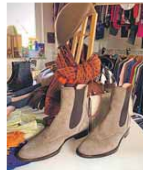
Jede Menge chice Mode für die ganze Familie findet man im Allerlei in Aying.

AYING · Das »Allerlei«, der Secondhandladen des Vereins Dorfleben und Soziales in der Gemeinde Aying hat ab dem 4. Februar den Rotstift angesetzt. Besonders interessant macht einen Besuch im beliebten Laden die Tatsache, dass dann die sowieso schon günstigen Preisen nochmals halbiert werden. Im gesamten Februar kann man nochmals richtig sparen und für kleines Geld tolle Mode für die ganze Familie kaufen. Hier findet man vom Babystrampler bis hin