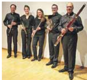
Das Holzbläserquintett lädt gleich zu zwei Babykonzerten in den Pfarrsaal Mariä Geburt ein.

Zwei wichtige Hinweise: Kinderwagen und Schuhe bleiben bitte im Vorraum. Größere Geschwister können gerne mitgebracht werden, sollten aber bitte bei den Eltern bleiben. Eintritt: Familien mit einem Erwachsenen 12 Euro, Familien mit zwei Erwachsenen 15 Euro, Oma/Opa-Stühle: 8 Euro. Kein Vorverkauf! Einlass und Tageskasse um 14.30 Uhr bzw. um 16 Uhr.