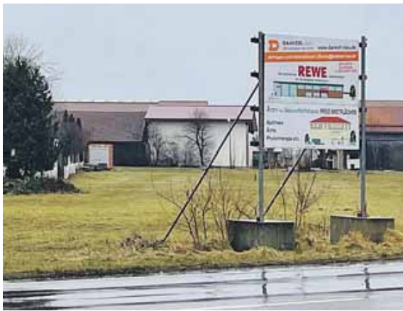
Jetzt wird's ernst, der Bau des lang ersehnten Supermarktes soll noch in diesem Jahr starten.