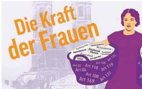
Die »Omas gegen rechts« zeigen in der Stadtbibliothek ihre Theaterperformance.

Im Mittelpunkt dieser Veranstaltung steht die unbeirrbar Kraft der Frauen, die in der