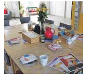
Auch zur Wahl 2021 gab es Wahltagcafés, hier in Ramersdorf.

Das Wahltagcafé ist ein Angebot des Projekts Demokratie-Lokal gemeinsam mit Münchner Nachbarschaftstreffs. Die Zusammenfassung aller Angebote des Demokratie-Lokals zur Wahl sowie weitere aktuelle Informationen zur Veranstaltung gibt es unter www.quarter-m.de/einfache-wahl-bundestag-2025