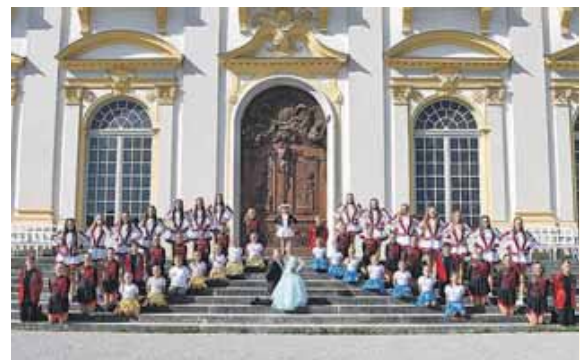
Macht überall ein gutes Bild: die Tanzgarde des Olympia-Faschingsclubs Karlsfeld.

von 12.00 bis 13.00 widmet, kann man sich schon auf den alljährlichen Auftritt des Moosacher Faschingsclubs freuen, der ab 13.00 Uhr stattfindet. Am Nachmittag gibt es Stimmungsmusik und leckere Krapfen. Wer mag, darf gerne verkleidet ins ASZ kommen. Anmeldungen für das Mittagessen und die Feier werden bis Montag, 24. Februar, unter Telefon 35627733-0 oder per E-Mail an die Adresse asz-milbertshofen@awo-muenchen.de entgegengenommen. Das Mittagessen kostet 7 Euro; Ermäßigungen sind auf Anfrage möglich.