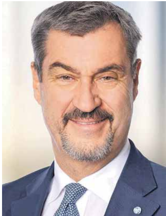
Ministerpräsident Markus Söder: »Ein Richtungswechsel ist mit den Grünen nicht möglich.«

Markus Söder: Neben dem massiven Ausbau der Erneuerbaren Energien führt kein Weg an einer Renaissance der Kernenergie vorbei. Wir müssen die noch vorhandenen Kernkraftwerke reaktivieren, moderne Kleinreaktoren bauen, mit Ländern wie Tschechien und Frankreich kooperieren und zur Kernfusion forschen. Wir dürfen keine Zeit mehr verlieren. Denn je länger wir noch warten, desto teurer wird der Wiedereinstieg. Der überstürzte Ausstieg mitten in einer großen Krise war ein großer Fehler. Insbesondere die Grünen haben dabei gezeigt, dass ihnen ihre Ideologie wichtiger ist als das Wohl unseres Landes. Für die Versorgungssicherheit brauchen wir kurzfristig aber auch einen Ausbau der Gaskraftwerke. Wir sollten uns nicht von teurem Fracking-Gas aus den USA abhängig machen. Deshalb müssen wir auch die Förderung heimischer Vorkommen untersuchen. In Niedersachsen beispielsweise gibt es ein großes Potenzial für Fracking-Gas.