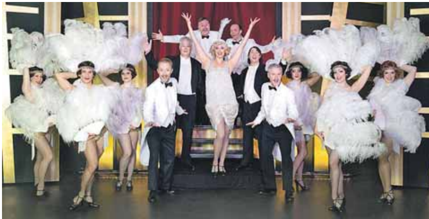
Am 8. Februar findet gibt es in der Stadthalle Germering eine Revue-Operette von Paul Abraham zu sehen.

Paul Abrahams 1932 uraufgeführter »Ball im Savoy« war der dritte große Erfolg in Folge, der den Komponisten zum unbestrittenen Star am Berliner Operettenhimmel machte. Nach »Viktoria und ihr Husar« und »Die Blume von Hawaii« versammelte er in »Ball im Savoy« alles, was das Mu-