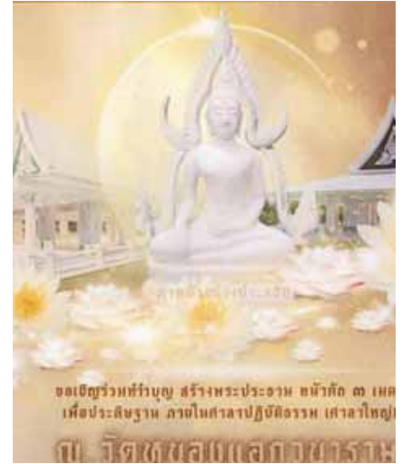
Diese Buddhafigur am Tempel Ban Nong Aek in Thailand soll mit Hilfe der Spenden fertig gestellt werden.

In dem Studio in der Römerstraße 59 in Gilching können sich die Kunden zwischen 9 und 19 Uhr von der Massseurin mit einer 45-minütigen, professionellen Thai-Massage behandeln lassen. Dazu gibt es kulinarische Spezialitäten aus der thailändischen Heimat – und das alles zum Preis von 35 Euro. Um Wartezeiten zu vermeiden, wird um