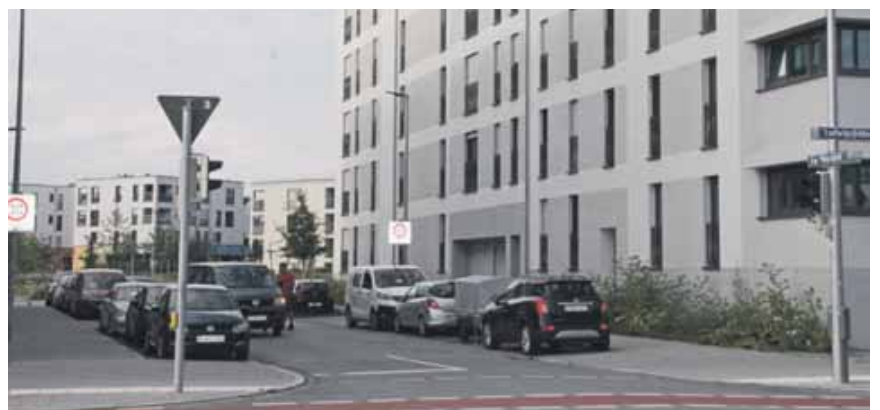
Das ehemalige Diamaltgelände ist inzwischen zum Wohnquartier geworden. Andere Bauvorhaben sind noch in der Planungsphase.

Zwei Bürgeranträge wurden von den Versammlungsteilnehmern sogar einstimmig angenommen. Bei dem einen handelt es sich um mehr Aufenthaltsgemeinschaften im Stadtviertel für die Jugend, beim anderen geht es um den Wunsch einer Bürgerin nach einer Parkbank zum Rasten auf ihrem langen Weg zum Friedhof.