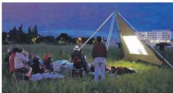
Premiere: das Grete-Pop-Up-Kino in Kooperation mit dem Kunstprojekt Kaleidoskop Freiham.

Der Film wird ab 21.15 Uhr gezeigt. Es wird darum gebeten, eine Picknickdecke oder eine andere Sitzgelegenheit und ggf. Wunschgetränke mitzubringen. Gekühlte Soft-Drinks und ein paar Snacks werden vom Team Feuerwerk bereitgestellt. Eintritt frei.