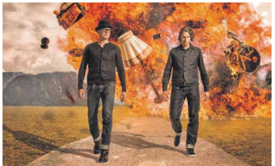
Die »Guten A-Band« unterhält am Donnerstag die Festgäste.

Nachtstark, die Kultband vom Münchner Oktoberfest, spielt am Freitag.