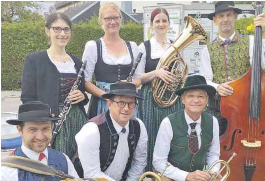
Die Menzinger 7e auf'd Nacht Musi

UNTERMENZING (red) · Musi für die Gäste auf. Die Am Freitag, 26. Juli, wird das Programm des Straßenweinfestes vom Heimat- und Volkstrachtenverein D'Würmtaler Menzing e.V. gestaltet. Ab 16.30 Uhr spielt die Menzinger 7e auf'd Nacht Trachtenvereins, zum Teil sind sie von außerhalb dazugestoßen. Die Besucherinnen und Besucher dürfen sich außerdem auf Volkstänze des Trachtenvereins und auf die Goaßlschnalzer freuen.