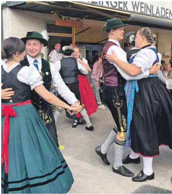
Die Aktivgruppe des Trachtenvereins D'Würmtaler Menzing trat schon beim ersten Straßenweinfest vor dem Menzinger Weinladen auf.