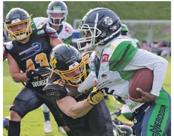
Die Munich Cowboys treten gegen die Straubing Spiders an.

Beide Teams wollen sich einen sicheren Spot in der Play-Off-Runde sichern und brauchen dafür unbedingt einen Sieg. Das Hinspiel in Straubing konnten die Cowboys mit 31:7 klar für sich entscheiden, allerdings haben sich die »Spinnen« aus Straubing während der Saison enorm gesteigert und stellen nun eine Herausforderung für die Cowboys dar.