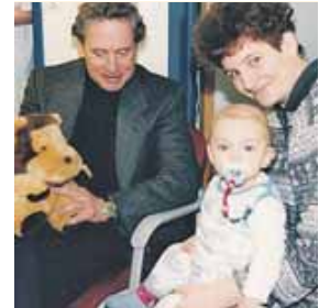
Michael Douglas scherzt mit Leukämiekindern in Sankt Petersburg.