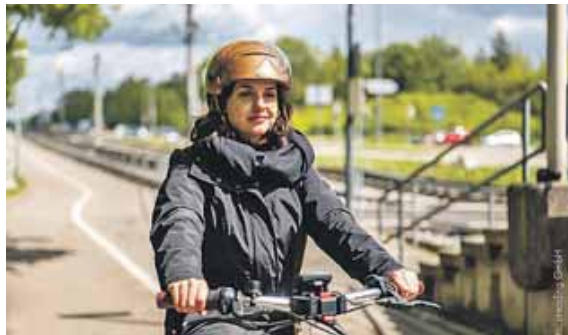
Sicherheit geht vor. Auch beim Fahrradfahren sollte die volle Aufmerksamkeit dem Verkehr gelten.

(red) · Ohne Handy geht heute kaum noch etwas. Nicht nur im Auto greifen immer mehr Menschen während der Fahrt zum Smartphone, auch beim Radfahren ist es fast immer parat. Die DEKRA-Unfallforscher warnen: Wer sich im Sattel ablenken lässt, geht ein erhöhtes Unfallrisiko ein. »Wir haben immer mehr Radfahrende, mehr Verkehr auf Straßen und Wegen und ein höheres Tempolevel durch Elektroantrieb – und leider auch steigende Unfallzahlen«, sagt Luis Ancona, Unfallforscher bei DEKRA. »Für Radfahrende kommt es darauf an, während der Fahrt bei der Sache zu sein.« Und weiter: »Wir wissen, dass die Nutzung des Smartphones beim Radfahren mit vielen Risiken verbunden ist. Insbesondere die visuelle Wahrnehmung des Ver-