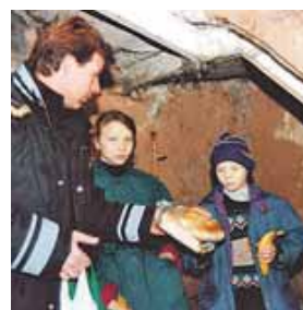
Patrick Lindner gibt Straßenkindern in Sankt Petersburg zu essen.