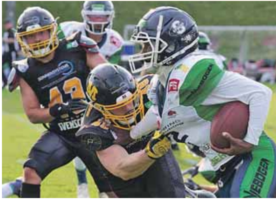
Die Munich Cowboys treten gegen die Straubing Spiders an.

MÜNCHEN (mc) · Am Samstag, 10. August, kommt es zu einem vorentscheidenden Duell zwischen den Munich Cowboys und den Straubing Spiders in der German Football League (GFL) Süd. Beide Teams wollen sich einen sicheren Spot in der Play-Off-Runde sichern und brauchen dafür unbedingt einen Sieg. Das Hinspiel in Straubing konnten die Cowboys mit 31:7 klar für sich entscheiden, allerdings haben sich die »Spinnen« aus Straubing während der Saison enorm gesteigert und stellen nun eine Herausforderung für die Cowboys dar.