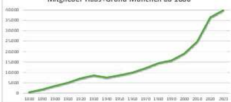
Mitglieder Haus+Grund München ab 1880