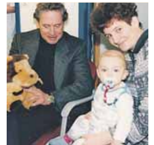
Michael Douglas scherzt mit Leukämiekindern in Sankt Petersburg.