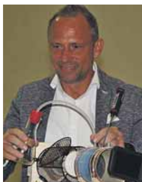
Umweltminister Thorsten Glauber: »Mit dem Klimakoffer werden Zusammenhänge verständlich!«

»Klimaschutz ist das Megathema unserer Zeit – gerade auch angesichts der verheerenden Überschwemmungen bei uns im Freistaat vor wenigen Wochen. Uns allen muss klar sein: Wir sind alle vom Klimawandel direkt oder indirekt betroffen und genau deshalb geht Klimaschutz auch uns alle etwas an!« Das betonte Kultusministerin Anna Stolz bei der Vorstellung des LMU-Klimakoffers. »Der LMU-