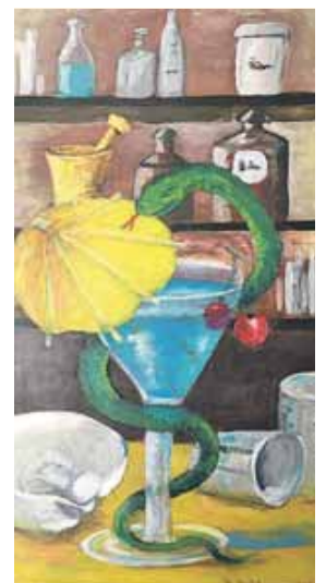
Acrylbild von Doris Michelmann.