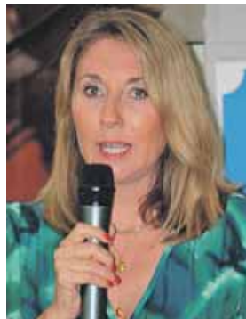
Kultusministerin Anna Stolz: »Bereits jetzt engagieren sich 60 zertifizierte Klimaschulen in Bayern aktiv für den Klimaschutz.«