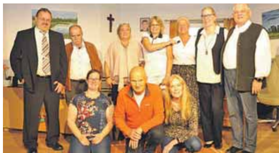
Das Team des Sendlinger Komödienbrettls freut sich auf die Premiere mit vielen Besuchern.

Und darum geht es: Der ICE 6948 muss einen außerplanmäßigen Halt einlegen. Alle Fahrgäste sind an einem einsamen Provinzbahnhof gestrandet. Ohne Handyempfang, ohne Taxis, ohne Aussicht auf eine baldige Weiterfahrt. Stattdessen erfahren sie, dass sich unter den Fahrgästen womöglich ein Psy-