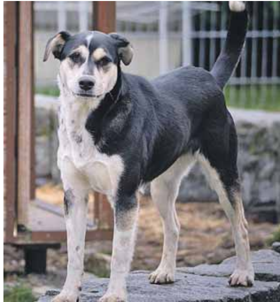
Bura ist einer von vielen Hunden, die gerne auf ein Faschingskostüm verzichten.

Ein »bunter Hund« wirkt auf andere womöglich bedrohlich und ruft Aggressionsverhalten hervor. »Das hat Ihr Zamperl doch wirklich nicht verdient, oder? Auch ohne Kostüm sollten Sie Ihren Hund nicht zu Faschingsveranstaltungen mitnehmen, weder drinnen noch drau-