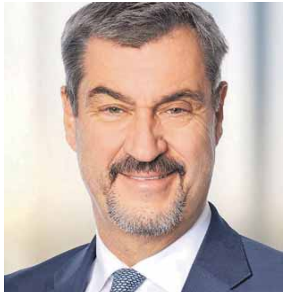
Ministerpräsident Markus Söder: »Ein Richtungswechsel ist mit den Grünen nicht möglich.«

Wie realistisch ist eine Rückkehr zur Atomkraft?