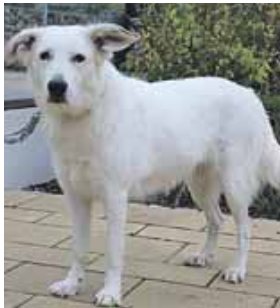
Schäferhund Mischlingshündin Betty wartet im Tierheim auf neue Besitzer.

MÜNCHEN (red) · Im Münchner Tierheim wartet derzeit Schäferhund Mischlingsdame Betty auf ein neues Zuhause. Sie kam ins Tierheim, weil ihr Besitzer verstorben ist. Aktuell wiegt sie 35 Kilogramm und hat eine Schulterhöhe von 60 Zentimetern. Betty ist eine verschmuste und zutrauliche Hundedame, welche aber eine konsequente Führung benötigt. Bei Artgenossen entscheidet sie sehr nach Sympathie, sucht aber lieber ein Zuhause in Einzelhaltung. Die hübsche Hündin benötigt Spezialfutter. Hierzu beraten gerne die Pfleger des Tierheims. Wer sich für Betty interessiert, kann sich unter Tel. 089/92 10 00-43 melden.