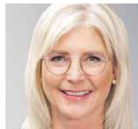
Mdl Ulrike Scharf, Bayerische Staatsministerin für Familie, Arbeit und Soziales weist auf das Angebot der Seniorenmitwirkung hin.

Bayerns Sozialministerin Ulrike Scharf: »Der bayernweite Dialogprozess »SeniorenMitwirkung« hat gezeigt, dass die