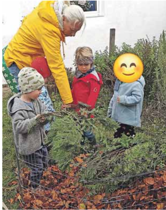
Der Truderinger Kindergarten Spatzennest hat einem Igel in seinem Garten ein neues Zuhause geschenkt.

MÜNCHEN (job) · Der Truderinger Kindergarten Spatzennest hat einen Igel aus dem Tierheim in seinem Garten ein neues Zuhause geschenkt. Gemeinsam mit den Erzieherinnen haben die Kleinen ein Winterquartier für den Stachelritter gebaut. Die auf den Namen Lillifee getaufte Igeldame wurde vor ihrem Winterschlaf fleißig mit Wasser und Futter versorgt und jetzt müssen sich die Kinder in ganz viel Geduld üben, bis Lillifee im Frühling wieder aufwacht.