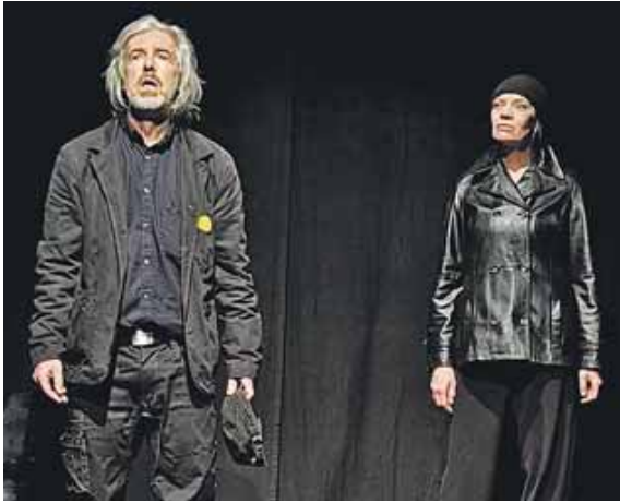
Das Ensemble von »gruppo di grappa« spielt »Fahrenheit 451« in der Pasinger Fabrik.

PASING (red) - »Fahrenheit 451« lautet der Titel des Stücks, das am Freitag, 24. Januar, und Samstag, 25.