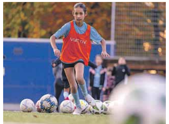
Training bei Mädchen an den Ball.

Durch die partnerschaftliche Unterstützung der VIACTIV Krankenkasse, einem der Hauptförderer von »Mädchen an den Ball«, legt das Erfolgsprojekt den Fokus auf den gesundheitlichen Aspekt von Fußball, denn die regelmäßige Bewegung an der frischen Luft stärkt das Immunsystem, sorgt für eine gesunde Gewichtsentwicklung sowie für einen gesunden Schlaf. Aspekte, die auch schon in jungen Jahren – die Teilnehmerinnen von »Mädchen an den Ball« sind zwischen sechs und 16 Jahren alt – nicht zu vernachlässigen sind. Dabei kann »Mädchen an den Ball« auf die langjährige Expertise der VIACTIV zurückgreifen, denn die Krankenkasse fördert immer wieder in zahlrei-