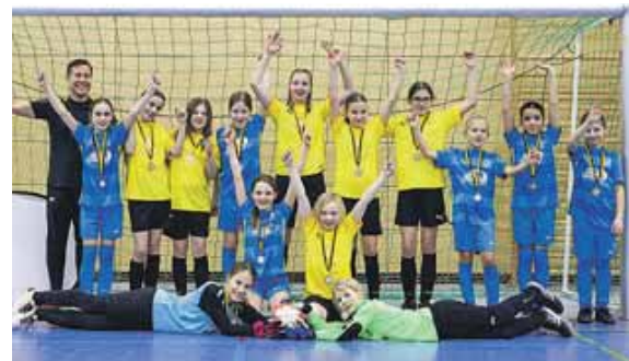
Große Freude herrschte bei den Juniorinnen des Gastgebers SC Weßling über das erste Mädchen-Turnier im Rahmen der M-net Hallentage.

WESLING (red) · Über einen großen Zuschauerzuspruch hat sich der SC Weßling zum ersten Wochenende der M-net Hallentage gefreut. Als besonderes Highlight zog dabei der bekannte Schiedsrichter-Influencer »Qualle« die Fans in Scharen an – mit rund 250.000 Followern auf Instagram und einer Million Fans auf TikTok ein echter Social-Media-Star. Er war auf Einladung des Titelsponsors M-net nach Weßling gekommen, um einige Spiele zu pfeifen und anschließend seine Fans mit einer Autogrammstunde und Selfies glücklich zu machen.