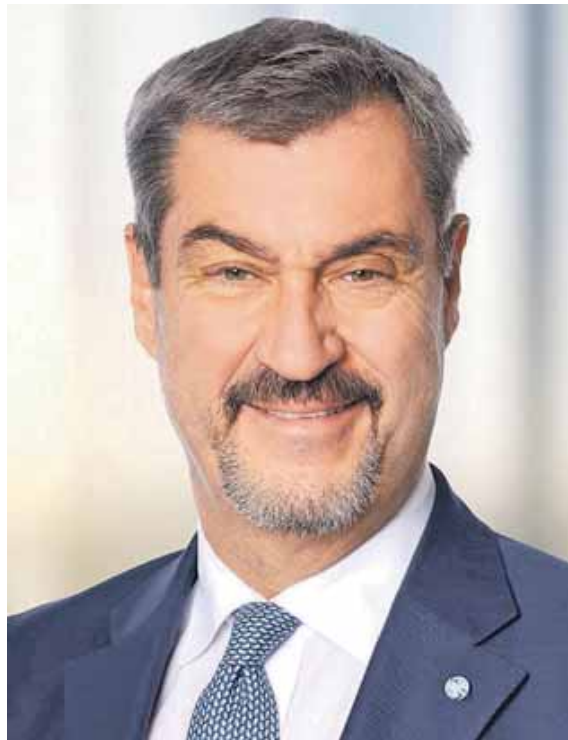
Ministerpräsident Markus Söder: »Ein Richtungswechsel ist mit den Grünen nicht möglich.«

Markus Söder: Neben dem massiven Ausbau der Erneuerbaren Energien führt kein Weg an einer Renaissance der Kernenergie vorbei. Wir müssen die noch vorhandenen Kernkraftwerke reaktivieren, moderne Kleinreaktoren bauen, mit Ländern wie Tschechien und Frankreich kooperieren und zur Kernfusion forschen. Wir dürfen keine Zeit mehr verlieren. Denn je länger wir noch warten, desto teurer wird der Wiedereinstieg. Der überstürzte Ausstieg mitten in einer großen Krise war ein großer Fehler. Insbesondere die Grünen haben dabei gezeigt, dass ihnen ihre Ideologie wichtiger ist als das Wohl unseres Landes. Für die Versorgungssicherheit brauchen wir kurzfristig aber auch einen Ausbau der Gaskraftwerke. Wir sollten uns nicht von teurem Fracking-Gas aus den USA abhängig machen. Deshalb müssen wir auch die Förderung heimischer Vorkommen untersuchen. In Niedersachsen beispielsweise gibt es ein großes Potenzial für Fracking-Gas.