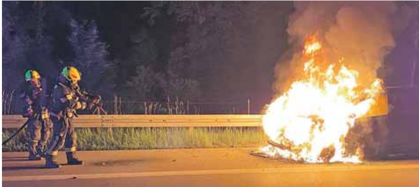
Zu einem gefährlichen Löscheinsatz bei einem brennenden Auto wurde die Freiwillige Feuerwehr Gilching auf die Autobahn gerufen.

von 355 Einsätzen. Vor allem der Starkregen und das Hochwasser im Juni haben mit 86 Einsätzen die Zahlen nach oben getrieben. Die Geisenbrunner wurden zu 83 Einsätzen gerufen. Feuer, Brand, Unwetter, Unfälle – das gesamte Leistungsspektrum war gefordert. Neben tragischen Einsätzen wie bei den Gilchinger die Bergung eines Tauchers aus dem Jaisweiher, mussten die Floriansjünger beider Wehren Brände löschen, zu Unfällen und technischen Hilfeleistungen ausrücken. Es gab auch lustige Einsätze. So komplimentierten die Gilchinger einen Schwan aus einem Verkaufsraum und spendeten beim Grundschul-Sommerfest den Kindern einen kühlen Regenschauer aus dem Schlauch. Ein nicht alltäglicher Einsatz in Geisenbrunn war die Ber-