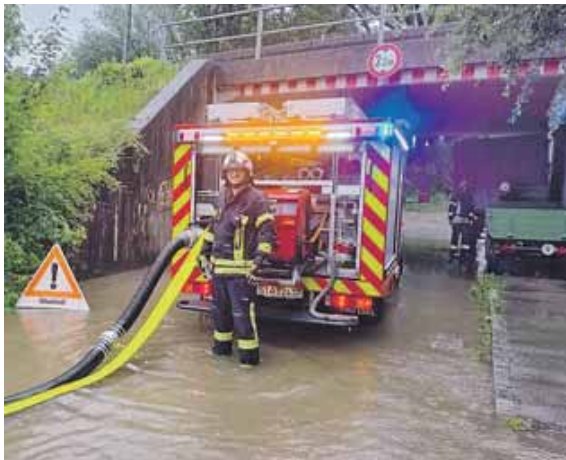
Die Geisenbrunner Feuerwehrler pumpen eine überflutete Unterführung leer.

GILCHING (pst) · Für die beiden Ortsfeuerwehren ist 2025 ein besonderes Jahr. Die Freiwillige Feuerwehr Geisenbrunn feiert ihr 125-jähriges Bestehen mit einem Festwochenende vom 27. bis 29. Juni und ihre Kollegen aus der Gilchinger Wehr freuen sich auf den Spatenstich im April für das lang ersehnte Feuerwehrhaus, das auf der ehemaligen Festwiese errichtet wird. Bei ihren jeweiligen Jahresversammlungen erinnerten die Vorsitzenden und Kommandanten an die Highlights des vergangenen Jahres. Die Feuerwehr Gilching hatte einen Rekord