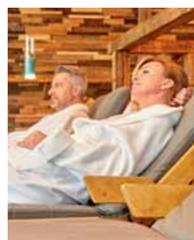
3.600 m 2 Thermal-Wellness-Landschaft